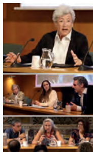
FOTOGRAFIES 8, 9 i 10