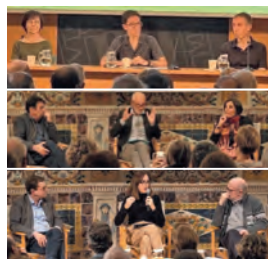
FOTOGRAFIES 5, 6 i 7