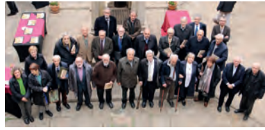
FOTOGRAFIA 16. Petita representació dels homenatjats, acompanyats dels membres de l'Equip de Govern de l'Institut.