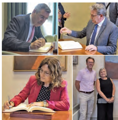
FOTOGRAFIES 43, 44 i 45